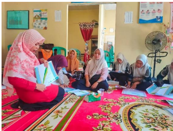
Gambar 5. Simulasi Penilaian KKA