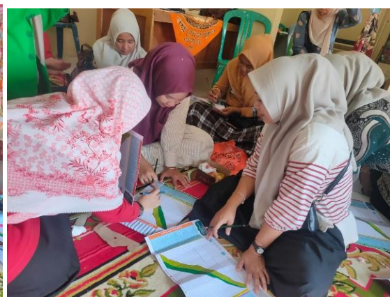
Gambar 6. Praktik Pengisian KKA oleh Kader