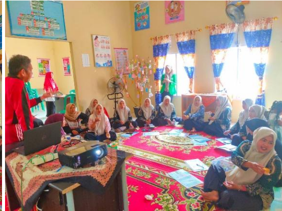
Gambar 4. Pembekalan Materi