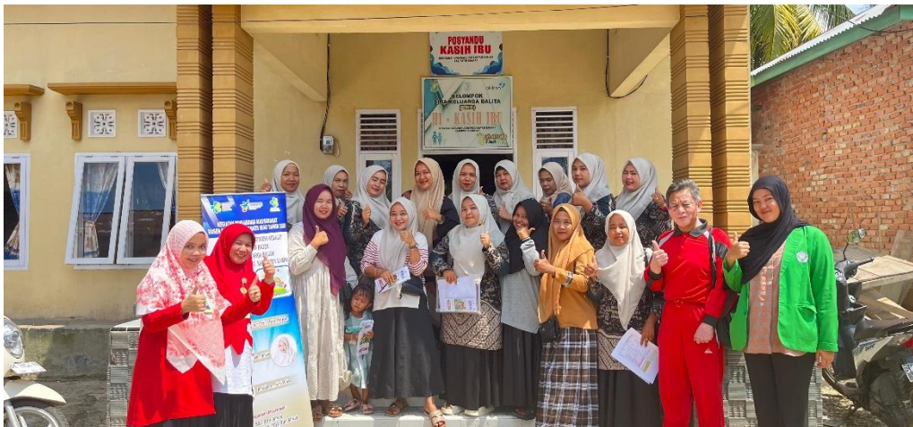
Gambar 2. Tim pengabmas bersama Kader Kesehatan di BKB Desa Ranah Singkuang Kab. Kampar.

Peserta kegiatan pengabdian kepada masyarakat adalah ibu-ibu kader kesehatan yang berjumlah 16 orang dari Posyandu Kasih Ibu di Desa Ranah Singkuang. Hasil pendataan biografi peserta pelatihan dengan karakteristik sebagai berikut dibawah ini :