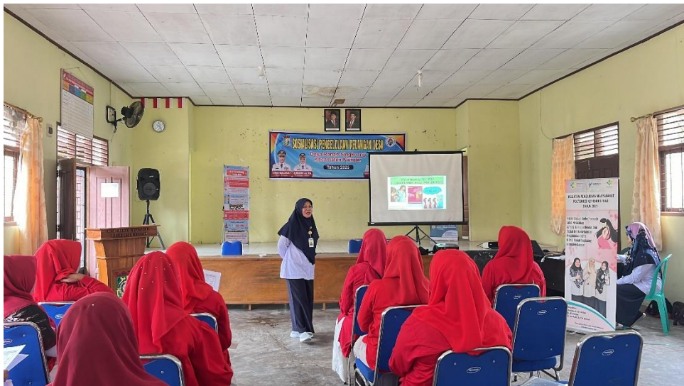
Gambar 1. Kegiatan pembekalan materi di Balai Desa Ranah Singkuang

Kegiatan pelayanan masyarakat ini juga mendorong pembentukan jaringan kolaboratif antara kader BKB, pejabat desa, tenaga kesehatan, dan masyarakat guna mencegah stunting. Kolaborasi ini memperkuat peran kader BKB sebagai mitra strategis dalam penyebaran program gizi dan kesehatan anak. Terdapat juga peningkatan kesadaran masyarakat, terutama di kalangan ibu balita mengenai pentingnya asupan gizi, kebersihan lingkungan, dan perilaku hidup sehat sebagai langkah konkret dalam mencegah stunting.