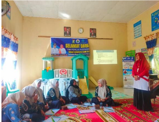
Gambar 3. Pemaparan Materi oleh Tim